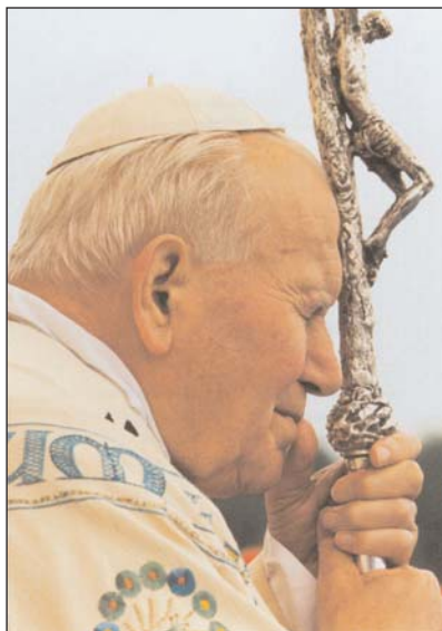
Der Herr über Leben und Tod rief am 2. April 2005 seinen treuen Diener Papst Johannes Paul II. (Karol Wojtyła) in seine ewige Herrlichkeit. Er wurde am 16. Oktober 1978 zum Papst gewählt.