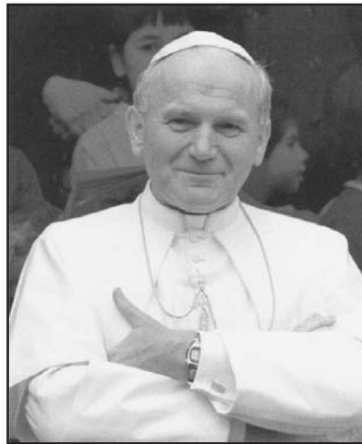
Papst Johannes Paul II. (†)

Er hat die Jugend der Welt mit dem Heiligen Geist angesteckt. Er hat sie begeistert für eine „neue Zivilisation der Liebe und der Gerechtigkeit“. Und er