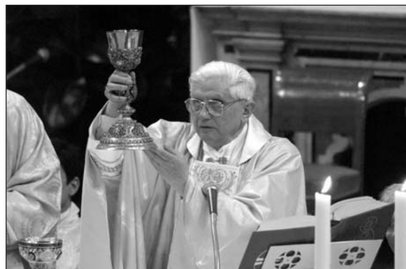
Der neue Papst Benedikt XVI. (Joseph Ratzinger)

In ähnlicher Weise äußerte sich Kardinal Ratzinger 1994 gegenüber Ermländer-Wallfahrern in Rom. Ihm sei die Arbeit der katholischen Heimatvertriebenen bekannt. Beim 30. Sudetendeutschen Tag in München 1979 wies er