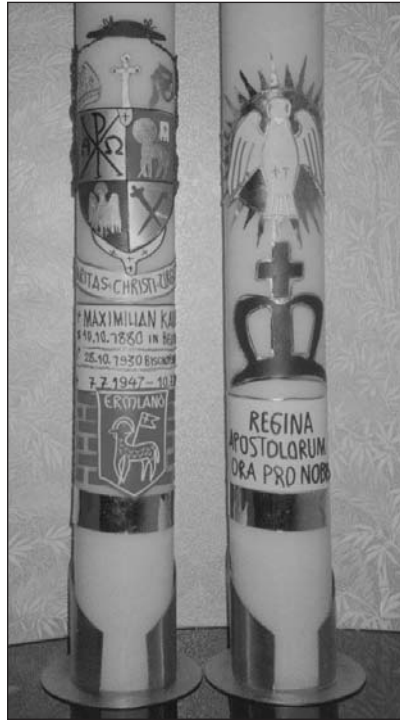
Werl-Wallfahrtskerzen 2005: (li) Kaller-Kerze, (re) Marien-Kerze.

Wahrhaft, die Taube gehört auf die Kerze. Mit ihr schlage ich aber auch eine Brücke zum Gnadenstuhl in Guttstadts Domkirche. In den Ermlandbriefen zu Ostern (1/2005, S. 8) berichtete ich, dass die Taube, das