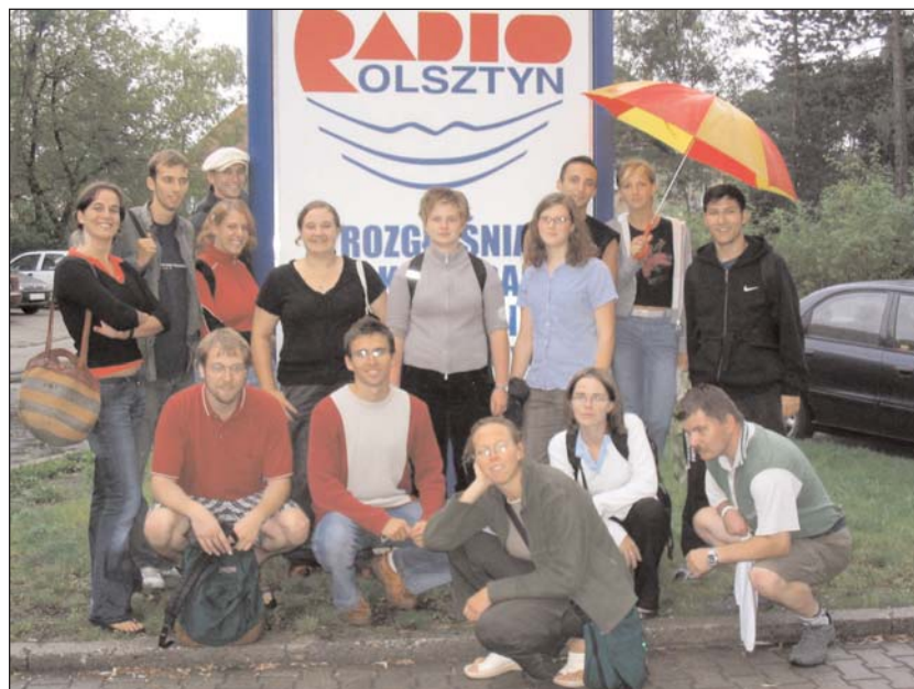
Teilnehmer des deutsch bzw. polnisch Tandem-Sprachkurses in Allenstein vor dem Gebäude von Radio Olsztyn (Radio Allenstein).

Im Haus der Allensteiner Gesellschaft Deutscher Minderheit standen uns Räume für den Unterricht und die Tandemeinheiten zur Verfügung. Meist endete der Tag in der Gruppe aber nicht mit dem Programm, bei dem wir am Nachmittag gemeinsam lernten. Die Stimmung war so gut und die Kontakte zueinander so schnell geknüpft, dass wir uns auch oft abends noch trafen, um miteinander zu grillen, zu kochen, Konzerte zu besuchen oder bei einem Bierchen in einer der Kneipen den Abend ausklingen zu lassen. Immer wieder sah