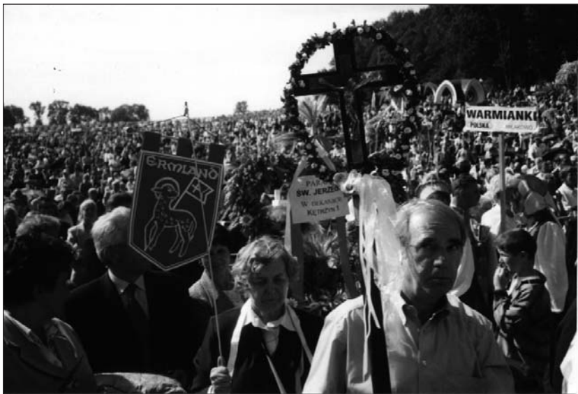
Großer Wallfahrtstag in Dietrichswalde (12. September) mit ca. 30.000 Gläubigen. Polnische und deutsche Christen feiern zusammen das heilige Messopfer mit Dank und Bitte um den Frieden in der Welt.

Wir setzten die Fahrt nach Braunsberg fort. Hier wurden wir mit großer Herzlichkeit von den Katharinen-