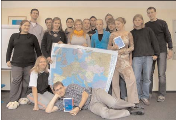
Die Teilnehmer der Essener-GJE-Tagung zum Thema „Die Europäische Verfassung“, das bis zum letzten Tag spannend gestaltet wurde.

Im Verlauf des Quiz zeigte sich, dass der Etat unserem immensen Wissen nicht standhalten konnte, so dass wir die mit Schweiß verdienten Bonbons durch falsche Antworten auf Fragen von einer gewissen Willkür wieder verlieren konnten.