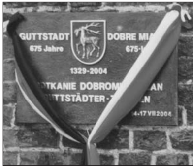
Die Gedenktafel an 675 Jahre Guttstadt und an dieses Treffen der Guttstädter.