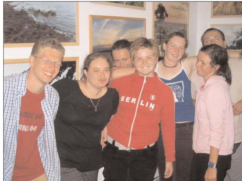
Das Vorbereitungsteam der Sommerjugendbegegnung 2004 im Ermland.

Und die Bilanz unserer Kanutour: Obwohl nur zwei Kanus während der