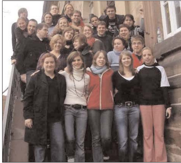
Der Führungskreis der Gemeinschaft Junges Ermland: analysiert die Arbeit der GJE des vergangenen Jahres 2006 und plant die Tagungen für das Jahr 2007.

Es war wirklich ein wunderschöner und unvergesslicher Abend, der auch in Teilen auf meinen Schuhen eindeutig dokumentiert ist. Der Grund dafür war der Tanz am Feuer auf den Maulwurfshügeln, wobei der Spaß, den wir