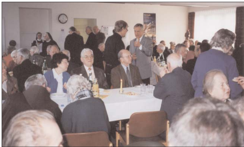
Gestärkt plaudern die sichtlich zufriedenen Gäste, denn anschließend begeben sie sich zur Überwasserkirche um die Christkindl-Messe zu feiern.

Einen „Glückwunsch“ an Schlesier, Grafschaft-Glatzer und Ermländer,