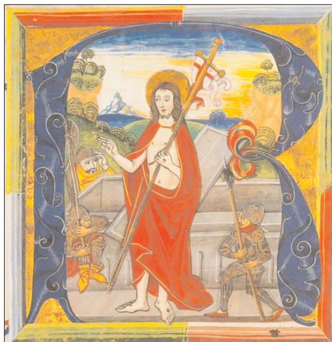
„Ihm kann kein Siegel, Grab noch Stein, kein Felsen widerstehn“. Auferstehung. Staatsbibliothek Bamberg.