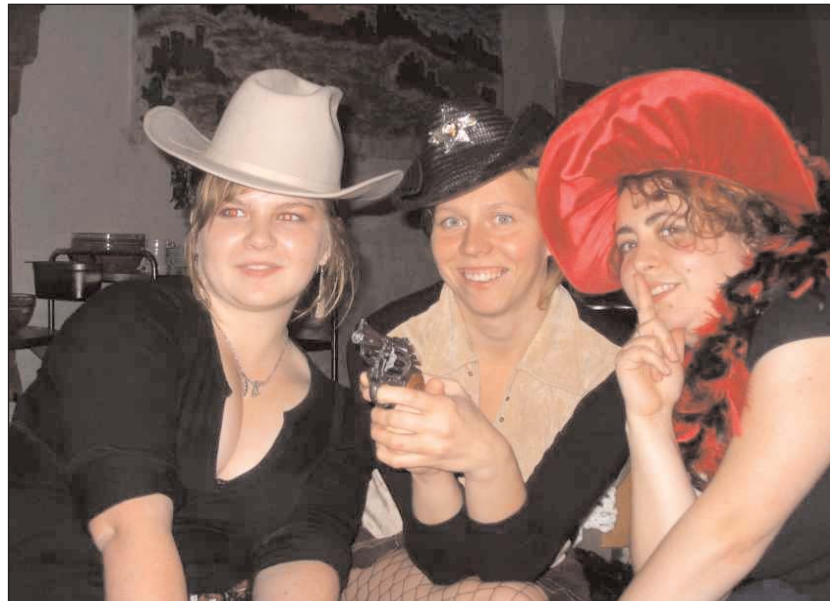
Verführerische Ladies (oben) verdrehten den nach langen Viehtrieben ausgedörrten Cowboys die Köpfe. Da musste so macher unerschrockener Kerl das erhitzte Gemüt mit blonden Getränken kühlen - siehe unten. Dies hatte zur Folge, dass die sonst stürmischen und unbändigen Männer mit fortschreitender Stunde müde und lustlos wurden. Ladies, was nun? - Mal ab und zu mit den Reizen geizen.

Geschrieben von Felix Teschner mit freundlicher Unterstützung von Angelika Seiller!