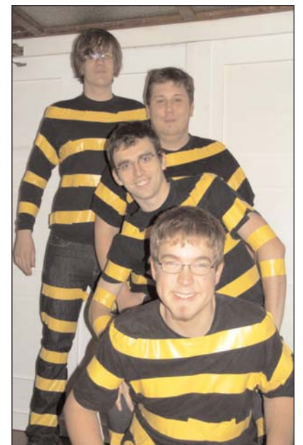
Wo es was zu feiern gibt, da sind die Daltons nicht weit. Auch hier versuchten sie Ärger zu machen, doch die Saloon-Chefin hatte sie im Griff.