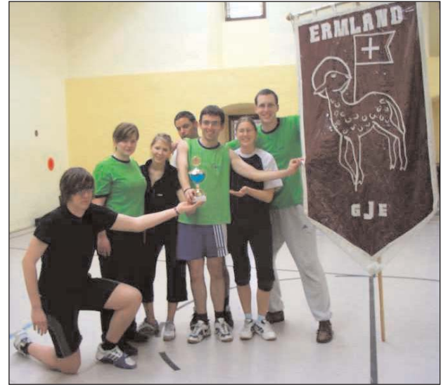
Die seit vielen Jahren ungeschlagene exzellente und ruhmreiche Volleyballmannschaft der GJE präsentiert neben der der GJE-Ermlandfahne den wohlverdienten Pokal.

hörte, an denen ein Streit zwischen Cowboys, Indianern und Sheriffs auf friedliche und sportliche Weise entschieden wurde.