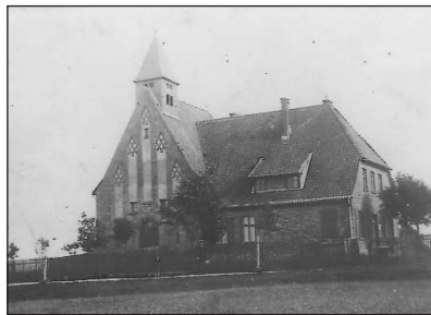
Diese evangelische Kirche in Reiffenrode hätte 2006 ihr 100-jähriges Jubiläum feiern können. Sie wurde allerdings 1956 abgebaut, um das Baumaterial anderweitig wieder zu verwenden.

Ich war angenehm überrascht, dass unsere Landsleute auf mein Rundschreiben hin so positiv und auch großzügig reagiert haben. Erwähnen möchte ich auch die beachtliche Spende von 230 € der Geschwister Hirschböck, Kinder des ersten evangelischen