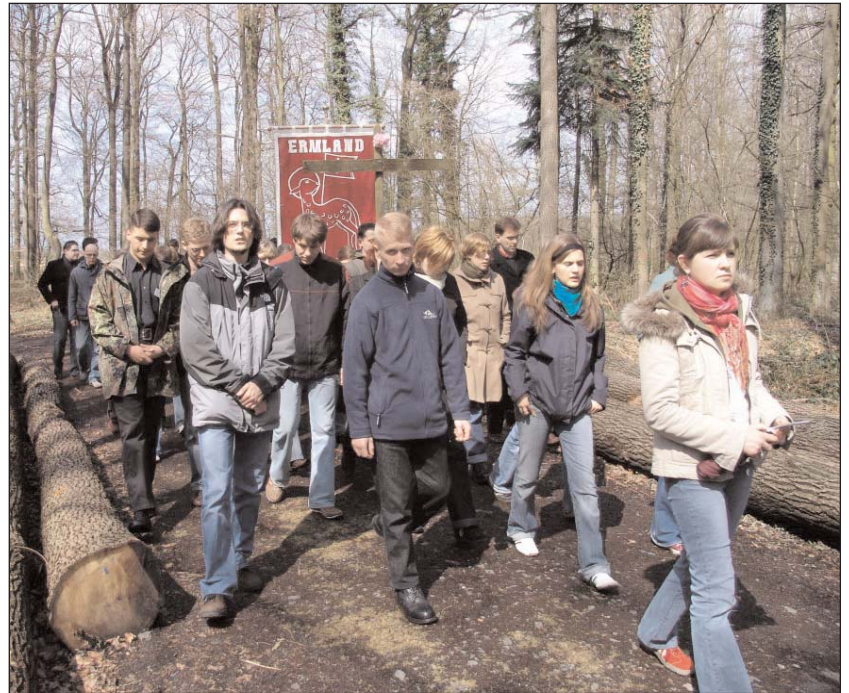
Ostertagung in Freckenhorst (2006): Selbstverständlich gehört die Liturgie dazu: Das Letzte Abendmahl, die Karfreitagliturgie, der Kreuzweg und die Osternacht

Sie kamen zu einem Grundstück, das Getsemani heißt, und er sagte zu seinen Jüngern: Setzt euch und wartet hier, während ich bete. Und er nahm Petrus, Jakobus und Johannes mit sich. Da ergriff ihn Furcht und Angst, und er sagte zu ihnen: Meine Seele ist zu Tode betrübt. Bleibt hier und wacht! Und er ging ein Stück weiter, warf sich auf die Erde nieder und betete, dass die Stunde, wenn möglich, an ihm vorübergehe.