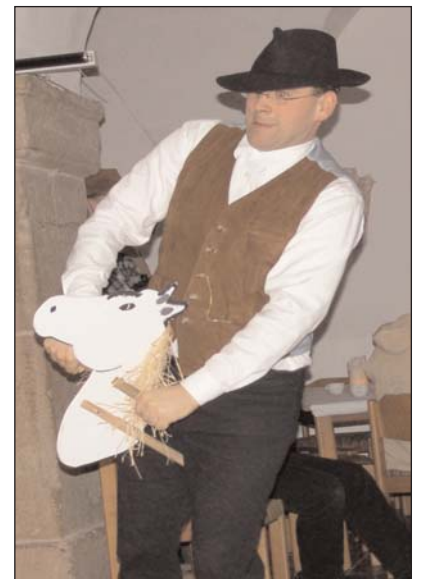
Mühevoll doch sichtlich mit sicherer Hand führt der Cowboy sein unbendiges Kraftpaket, einen Schimmel der eldesten ermländischen Westernrasse.