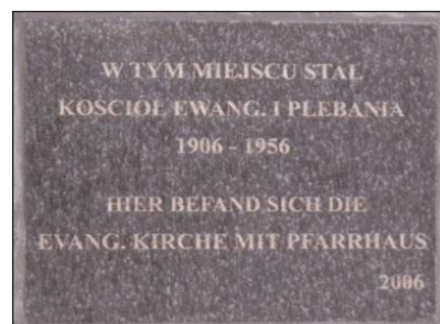
Das schlichte Kreuz mit einer Gedenktafel erinnert an die abgebaute evangelische Kirche in Reiffenrode