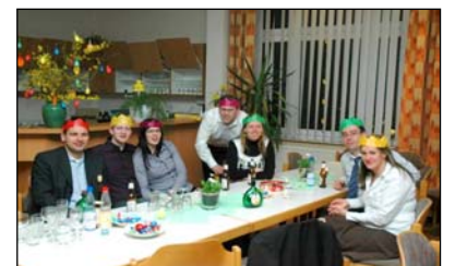
Der hohe Adel war ebenfalls beim bunten Abend zugegen, wie man an den gekrönten Häuptern erkennen kann.