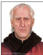
Der weltberühmte Astronom Nicolaus Copernikus, Domherr zu Frauenburg: Links: 2005 ist mit Hilfe moderner Computertechnik dieses Phantombild aufgrund des gefundenen Schädels entstanden. Rechts: Das bekannte Porträt des Astronomen im Thorner Rathaus, um 1580.