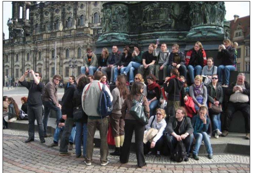
Teilnehmer der diesjährigen Jugendbegegnung vor Ostern vor dem Reiterdenkmal König Johanns (errichtet 1883 von Johannes Schilling) am Theaterplatz in Dresden. Im Hintergrund die Semperoper.

Auf viele Grenzen, die uns so umgeben, achten wir oft nicht. Die Grenzen innerhalb der EU kommen uns oft schon nicht mehr so bedeutsam vor. So kam es auch, dass noch nicht ein-