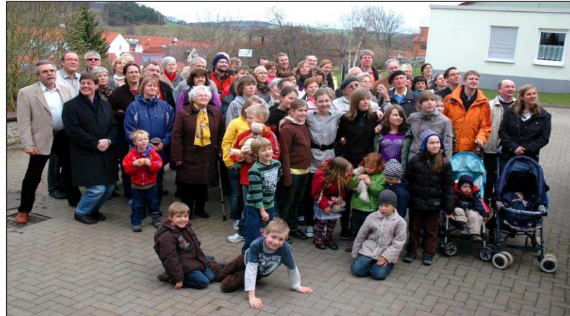
Zum Himmel empor schauend die Ermländerschar, denn aus der Höhe riefen die Fotografen zum Lächeln für das obligatorische Gruppenfoto.

bedarf es besonderer Formen und Bemühungen, um Kinder und Jugendliche für den Glauben und die Kirche zu begeistern. Hier nutzt Weihbischof Hauke die nach dem Zusammenbruch der DDR entstandene Lücke der kommunistischen Jugendweihe, die ja ihrerseits einst an Stelle der Firmung bzw. Konfirmation getreten war, um eine Feier der Lebenswende christlicher Art mit Andacht und Segen zu etablie-