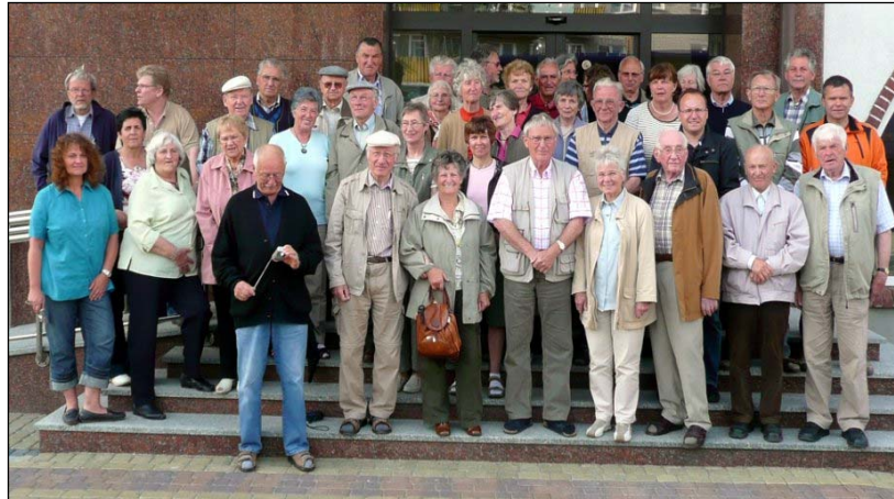
Die Peterswälder Reisegruppe vor dem neuen Hotel in Guttstadt.

Die Fahrt war nicht als touristische Unternehmung geplant, sondern als Begegnung mit den Stätten unserer Kindheit und Jugend. Der Austausch über Erfahrungen und Erinnerungen bis hin zu Flucht und Vertreibung war intensiv, besonders die Jüngeren unter uns wollten viel über das Leben vor