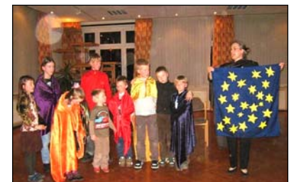
Bunter Abend am Ostersonntag: Die Kinder trugen uns die Geschichte von Abraham und seinen Söhnen vor.