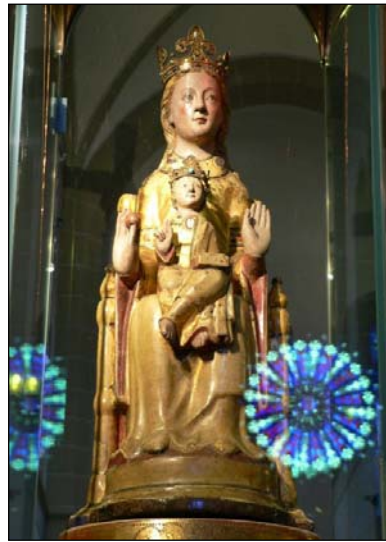
Das Werler Gnadenbild. Die Mutter der Betrüben.