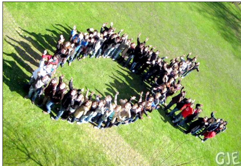
Durch und durch christlich: Teilnehmer der diesjährigen Ostertagung in Freckenhorst zeigen absolut öffentlich ihre Gesinnung und stellen sich zum urchristlichen Symbol auf - dem Fisch - griechisch: ICHTHYS.

Es war so, dass ich am Mittwoch Abend heiser wurde, Donnerstag konnte ich noch sprechen, singen fiel aber schon sehr, sehr schwer, Freitag war die Stimme ganz weg, auch Samstag konnte ich so gut wie gar nicht sprechen, Sonntag, Montag und Dienstag wurde meine Stimme von