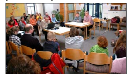
Im Plenum bei „Ermland Aktuell“