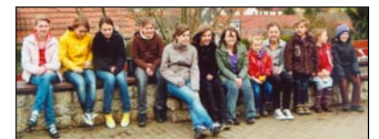
Der Nachwuchs für die GJE