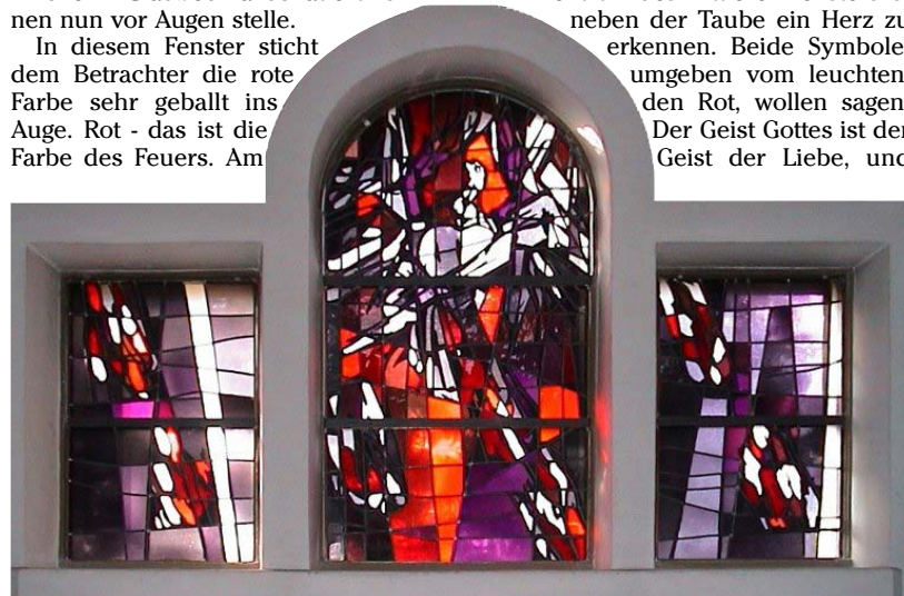
Firmung - Glasfenster in der Herz-Jesu-Kirche in Gladbeck-Zweckel von Dr. Egbert Lammers aus Werl, 1965

In diesem Fenster sticht dem Betrachter die rote Farbe sehr geballt ins Auge. Rot - das ist die Farbe des Feuers. Am