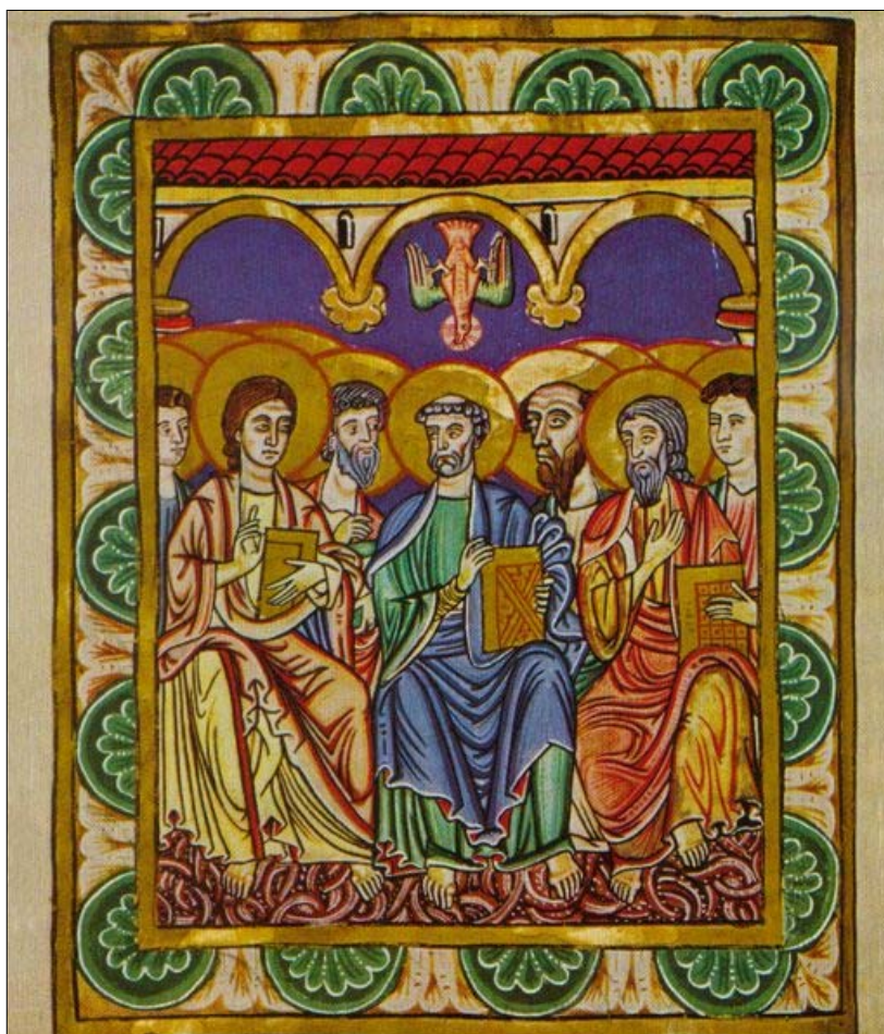
Pfingsten. Speyerer Evangelistar, um 1200, Karlsruhe, Badische Landesbibliothek